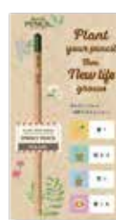
厚紙台紙 【2箇所切り込み】