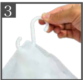
3 S字フックを完全に通したら完成です