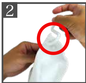
2 ポンプと対角の穴に対してS字フックを貫通させる