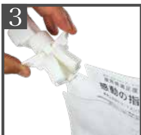
3 パウチの注ぎ口の奥までポンプを挿し込む