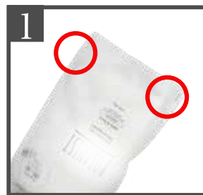
1 パウチ底面どちらかの穴を確認する